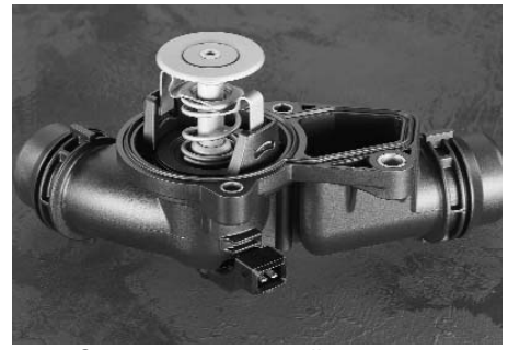
Электр. регулируемый термостат

Слишком большой поток еще не нагретой охлаждающей жидкости попадает